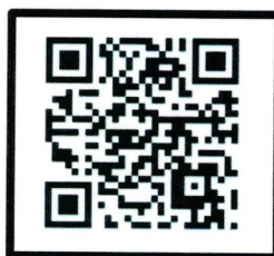
QR-code กองสาธารณสุข อบจ.ชลบุรี