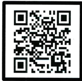
QR-code สรุปการประชุม กสพ.

๒.สรุปข้อมูลของผู้มีส่วนร่วม กสพ.ครั้งที่ ๗/๒๕๖๗ วันที่ ๗ ตุลาคม ๒๕๖๗